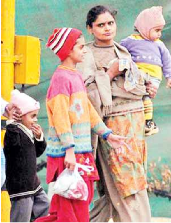
नहीं छोड़ता। लिहाजा स्कूलों में दस दिन का विशेष शीतकालीन

उत्तर भारत में हुए हिमपात के कारण शहर में बर्फाली हवाएं तेजी से चल रही हैं। ठंड की ठिटुरन से पूरा जनजीवन प्रभावित हो गया। प्रातःकालीन पाली में लगने वाली शालाओं में बच्चों का जाना और लेट लतीफ होने पर मिलने वाली सजा ठंड में दुगुनी परेशानी पैदा कर रही है। शिक्षक पालक संघ की मांग है, कि प्रातःकालीन शालाओं का समय बदलकर 9 बजे तो कर दिया पर 8 बजे तक ओस की बूंदें और कोहरा पीछा