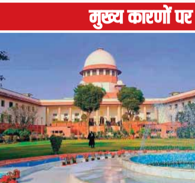
मुख्य कारणों पर रिपोर्ट जमा की जाए

मुख्य न्यायाधीश सूर्यकांत और न्यायाधीश जय्यामल्य बागची की पीठ ने आयोग को दो हफ्ते में एक्सपर्ट्स की एक मीटिंग बुलाने और बढ़ते प्रदूषण के मुख्य कारणों पर एक रिपोर्ट जमा करने का निर्देश दिया है। कोर्ट ने सख्त लहजे में पूछा कि क्या आप प्रदूषण के कारणों की पहचान कर पाए हैं? इन सभी दिनों में बहुत सारा मटेरियल पब्लिक डोमेन में आ रहा है, एक्सपर्ट्स आर्टिकल लिख रहे हैं, लोगों की राय है, वे हमें मेल पर भेजते रहते हैं।