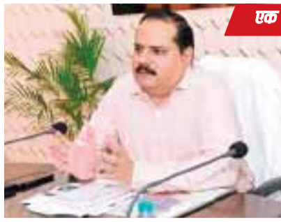
एक जनवरी 2008 से पहले जन्मे लोग फार्म दें

राज्य के मुख्य निर्वाचन अधिकारी नवदीप रिणवा ने बताया कि एक जनवरी 2008 से पहले जन्मे लोग फार्म भर सकते हैं। एक अक्टूबर से जो एलिजेबल हो रहे हैं, वे फार्म भर सकते हैं। जिनका फार्म मिला है, उनकी मैपिंग नहीं है। उन्हीं को नोटिस दिया जाएगा। छह मार्च 2026 को अंतिम सूची जारी की जाएगी। वेबसाइट से सीधे अपना नाम देख सकते हैं। रिणवा ने बताया कि आप वेबसाइट से सीधे अपना नाम देख सकते हैं। 27 अक्टूबर 2025 से प्रक्रिया शुरू हुई। 4 नवंबर से पहला चरण शुरू हुआ। उस वक्त 15 करोड़ 30 हजार 92 मतदाता थे। सभी का गणना प्रपत्र प्रिंट आउट लिया था। प्रपत्र घर-घर जाकर दिए गए। पहले एक सप्ताह के लिए समय बढ़ाया गया। फिर 11 दिसंबर को गणना चरण समाप्त होना था। 2.97 लाख नाम हट रहे थे, इसके लिए 15 दिन का अतिरिक्त समय दिया गया।